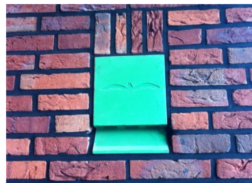
Opvallende prefab vleermuiskast in het buitenblad