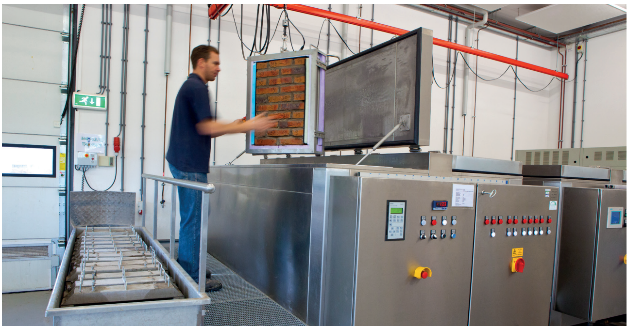
Beproeving element voor bepaling van de vorstbestandheid

water (5 mm diep) kan opzuigen. Dit getal, uitgedrukt in kg/(m 2 *min), is zeer belangrijk voor het geven van een juist morteladvies. Hoewel het voor CE-markering niet verplicht is de initiële wateropzuiging te declareren, wordt deze in Nederland wel vaak gegeven. Daarbij worden gebruikelijk de keuringscriteria voor de verschillende IW-klassen uit de BRL 1007 aangehouden (zie kader IW-klassen).