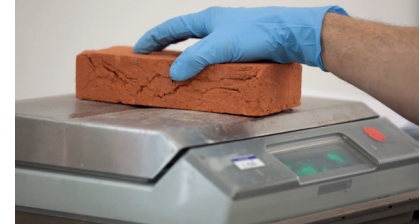
Bepaling volumieke masse