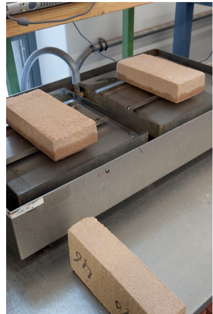
Bepaling van de initiële wateropzuiging

De initiële wateropzuiging (IW) is een maat voor de hoeveelheid water die een vooraf gedroogde baksteen in de eerste minuut in contact met