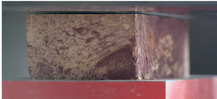
Bepaling van de druksterkte

De druksterkte wordt uitgedrukt in de gemiddelde druksterkte. Aangezien de proefstukgrootte van grote invloed is op de gemeten druksterkte van een metselsteen wordt ook wel gebruik gemaakt van de genormaliseerde druksterkte. Dat is de druksterkte van een referentiesteen met een vaste exacte maat van 100 mm breed en 100 mm hoog. De CE genormaliseerde druksterkte kan in Nederland niet altijd direct worden gebruikt voor het berekenen van de metseldruksterkte. Dat kan wel bij producten waarvan de hoogte kleiner of gelijk is aan de kleinste breedtemaat. En dat is bij gevelbaksteen gebruikelijk het geval. Voor stenen waarbij dat niet het geval is moet de in Nederland gebruikte genormali-