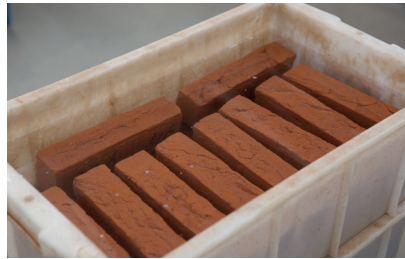
Bepaling van de wateropneming

De Europese klasse F2 geldt in het algemeen als eis voor strenge klimatologische omstandigheden en is (volgens BRL 1007) de minimale eis voor gevelmetselwerk in Nederland. De Nederlandse klasse C komt overeen met de Europese F2 klasse en is het meest gebruikt in Nederland. De hoogste Nederlandse klasse D komt overeen met de Europese F2 (80) en wordt gebruikt voor toepassingen waarbij extreem hoge vochtbelasting kan optreden, zoals in situaties waarbij metselbaksteen in permanent contact staat