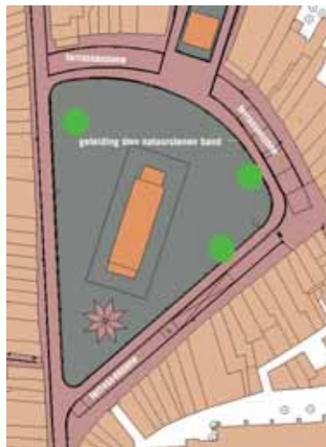
Het straatbeeld van Gouda in straten aangegeven. Overbodige elementen zijn verwijderd.