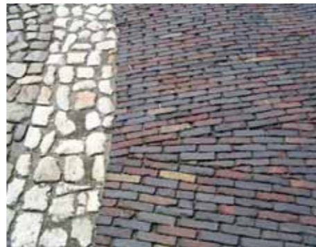
De verharding van Slot Zeist kent diverse elementen.