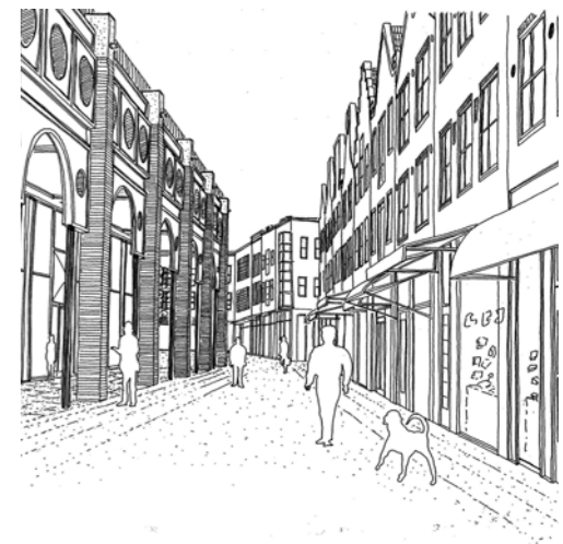
De huizen en winkels staan niet in een recht lint, zoals op deze tekening te zien, om de individualiteit en intimiteit van de panden te benadrukken.

Als tegenwicht voor de grote diversiteit aan architectuur en kleur in de gevels, koos de architect voor een zo rustig mogelijke invulling van het openbaar