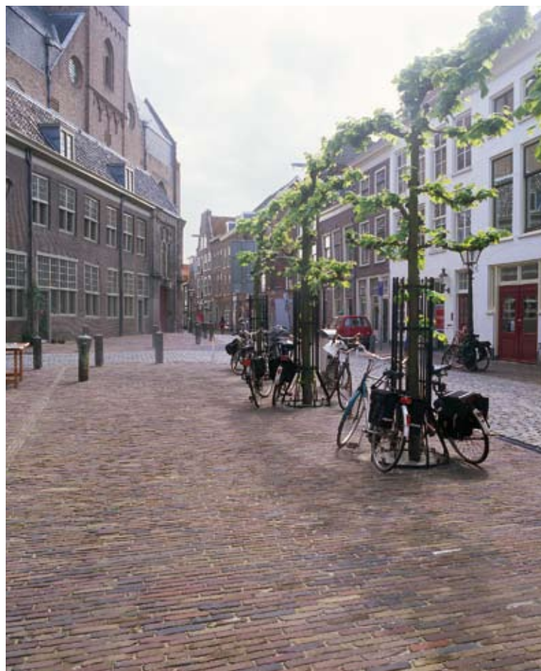
Locatie: Harlebergkerk, Leiden. Voorbeeld van historisch straatbeeld.

idee wat jouw meerwaarde is ten opzichte van andere steden." Schop vervolgt: "In de invulling van de eigenheid en meerwaarde van een stad komt het onderwerp 'ruimtelijke inrichting' om de hoek kijken. In de bestrating, maar ook het straatmeubilair, de verlichting, de beplanting en de architectuur van de omgeving profileert een stad zich. De stad kiest als het ware een gezicht dat bij haar past." In Rotterdam ziet Schop een goed voorbeeld van de samenhang tussen citymarketing en ruimtelijke inrichting. "De Kop van Zuid is gerealiseerd vanuit één stedenbouwkundig concept. Daaruit blijkt dat het bestuur een visie heeft op wat Rotterdam kenmerkt ten opzichte van bijvoorbeeld een stad als Amsterdam." In de wijze waarop onze hoofdstad het inrichtingsvraagstuk oplost, komt volgens Schop de valkuil van de marktleiderspositie tot uitdrukking. "De marktleider dreigt in te slapen. Dat zie je in Amsterdam in een inrichting van de open-