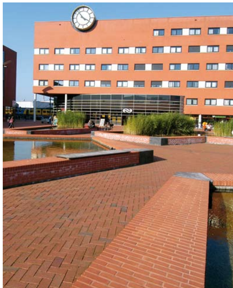
Locatie: plein NS-station, Zwolle. Voorbeeld van modern straatbeeld.

De concepten die ontwikkeld worden, geven concreet invulling aan de positionering die steden voor ogen staat. "Een veelgebruikt concept is de stijl van de jaren dertig. Ontwerpers grijpen terug naar traditie en authenticiteit in een reactie op de behoefte aan veiligheid, geborgenheid en herkenbare kaders." Het inrichten vanuit de 'cocoon'-gedachte tekent ook een parallelle ontwikkeling: het denken vanuit doelgroepen. "Door in de inrichting van de buitenruimte keuzen te maken, trek je automatisch een bepaalde gebruikersgroep aan. Ik vind dat we hier in Nederland nog te weinig bewust mee bezig zijn." Schop zet de situatie af tegen die in Groot-Brittannië en de Verenigde Staten waar steden volgens hem 'bewuster keuzen maken voor een bepaald concept en sfeerbeeld'. Als voorbeeld noemt hij steden als Londen en