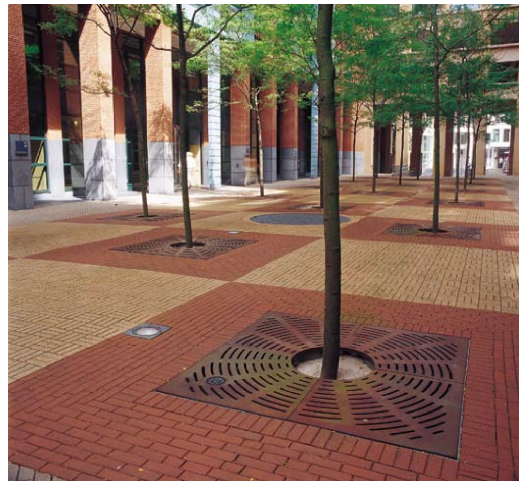
Locatie: Parnassusplein, Den Haag. Voorbeeld van 'eigentijds klassiek' straatbeeld.

Birmingham. "De Nederlandse equivalenten zijn Rotterdam, Almere en Maastricht."