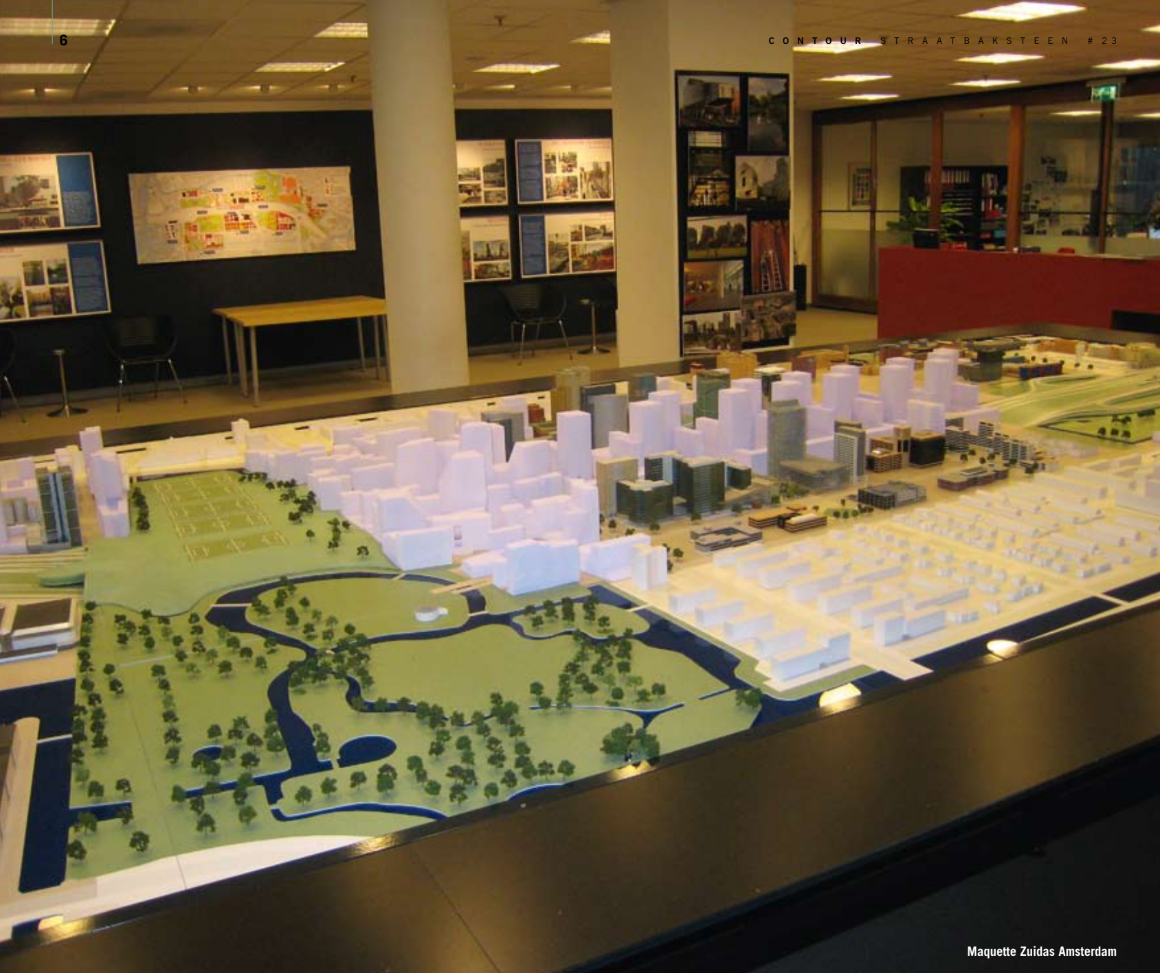
Maquette Zuidas Amsterdam